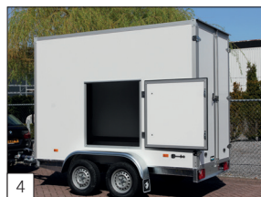
4 Option : petit hayon dans la paroi latérale.