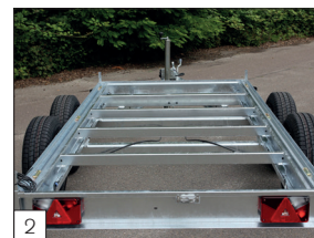
2 En série : châssis entièrement soudée et galvanisée, qui convient à toutes les versions à double essieu jusqu'à 3500 kg PTAC.