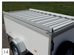
14 Option : galerie de toit en aluminium.