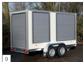
9 Option : volet roulant en aluminium à l'arrière et volets coulissants sur les côtés.