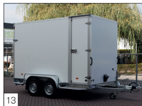
13 Option : porte latérale équipée d'un dispositif de fermeture et de suspension en acier inoxydable.