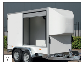
7 Option : volet coulissant en aluminium dans la paroi latérale.