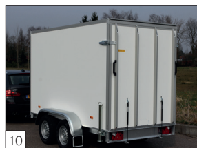
10 Option : rampe d'accès arrière sur ressorts à gaz et équipé d'une double fermeture à gauche et à droite.