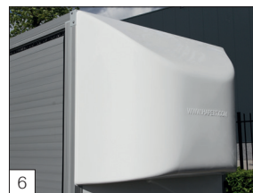
6 Option : spoiler (en polyester) monté à l'avant.