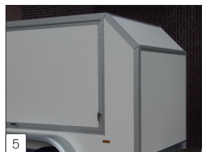
5 Option : partie avant inclinée (angle égal d'environ 40 x 40 cm).