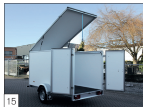
15 Option : couvercle pivotant à l'avant (option possible jusqu'aux dimensions maximales 300 x 150 x 180 cm).