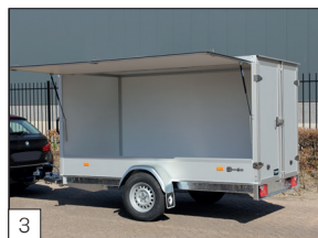
3 Option : hayon de vente latéral qui peut être monté aussi bien à gauche qu'à droite (dans le sens de la marche).