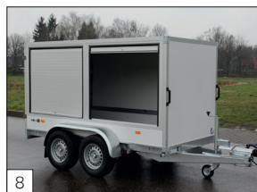
8 Option : 2 volets coulissants en aluminium (largeur maximale 150 cm) dans la paroi latérale, avec montant central.