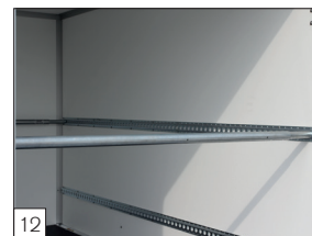
12 Option : système d'arrimage de la charge dans la structure fermée avec barre télescopique et sangle d'arrimage.