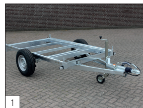
1 En série : châssis robuste, adaptée à toutes les versions simple essieu jusqu'à 1800 kg de capacité de charge brute incluse.