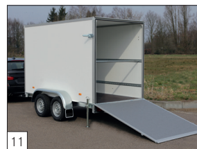
11 Option : rampe d'accès arrière avec revêtement gris anti-dérapant.